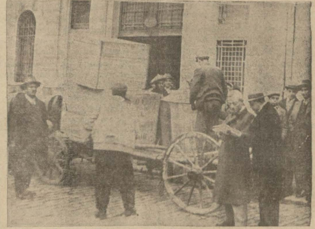
Gümrüklerden şehre eşya çıkarılıyor

Umumiyetle Amerikadan gelen altınlar ya külçe, yahut ta basılmış nükt halindedir. Bu altınlar ise çubuk halindedirler. Her fiçı, iki tarafından mühürlenmiştir. O suretle ki, bir fiçiyi